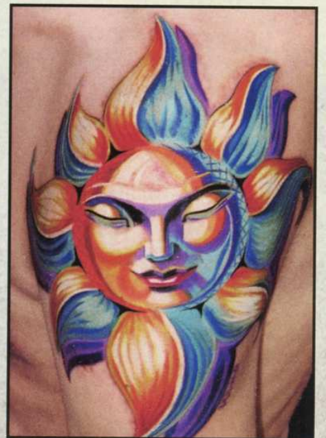
Sonniges von Waldi