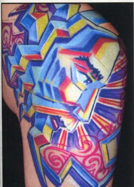
Häufig sind Portraits der Kern von Waldis Tattoos.

Vater und Tochter gekonnt auf den menschlichen Körpervoller Rundungen. Genau darin sieht Waldi die eigentliche Herausforderung: Das Kantige muss auf das Runde.