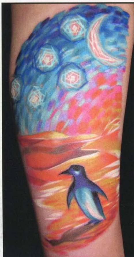
Pinguin in der Wüste von Osa