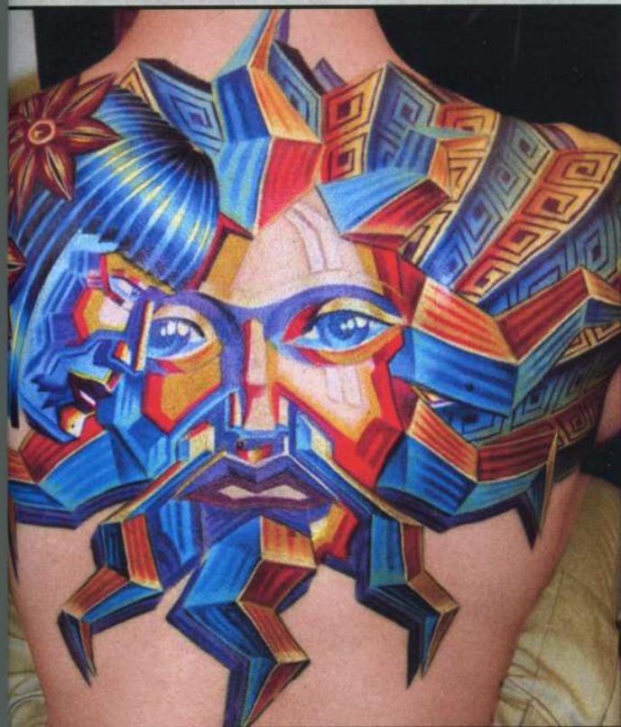
Waldi sieht die Herausforderung darin, kantige Bilder auf Körperrundungen zu übertragen.